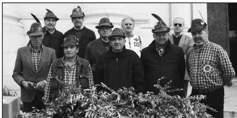
Alpini impegnati nella distribuzione dell'ulivo.

Il ricavato di questa manifestazione, oltre al contributo alle parrocchie, è utilizzato