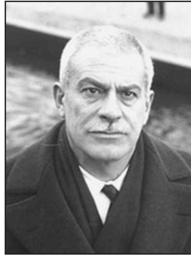
Elio Vittorini, Siracusa 1908-Milano 1966.

bellica, sottolineata con forza da un linguaggio ritmico ed incalzante, si confonde con la quotidianità dei singoli, e il dilemma profondo che compone il titolo, ossia la divisione tra gli 'uomini' e i 'non uomini' (cioè i carnefici), si risolve nello spaccato finale, nel quale un nazista non è poi così molto diverso da un gappista, e forse il fascismo, che rappresenta per Vittorini il male peggiore, è radicato in ognuno di noi, nei nostri rapporti privati, nella pratica di tutti i giorni.