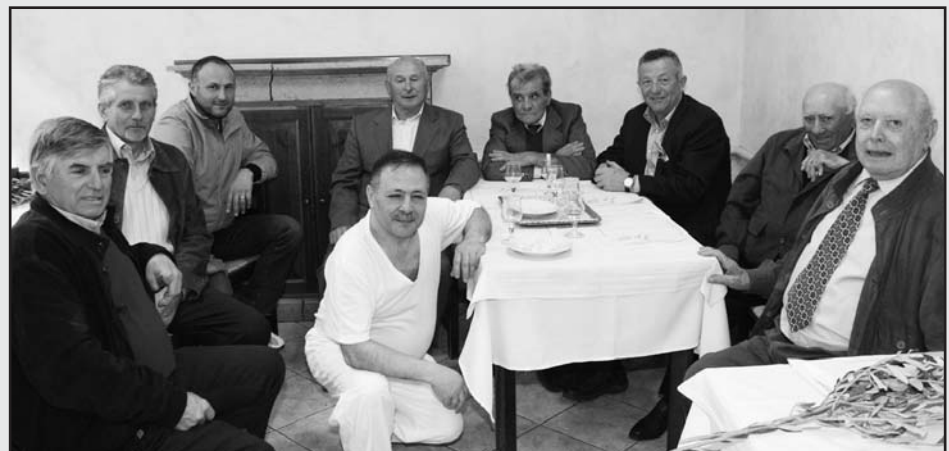
Una "scaglia" di formaggio come aperitivo speciale.