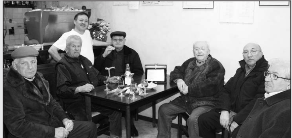
Gli amici fedeli di un ritrovo immancabile.