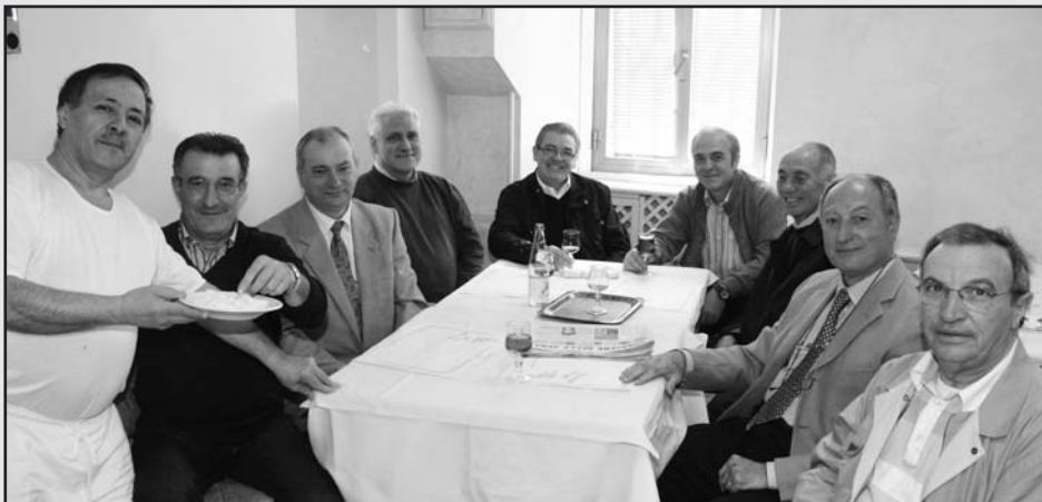
"Rivalità politiche" annacquate dall'aperitivo.