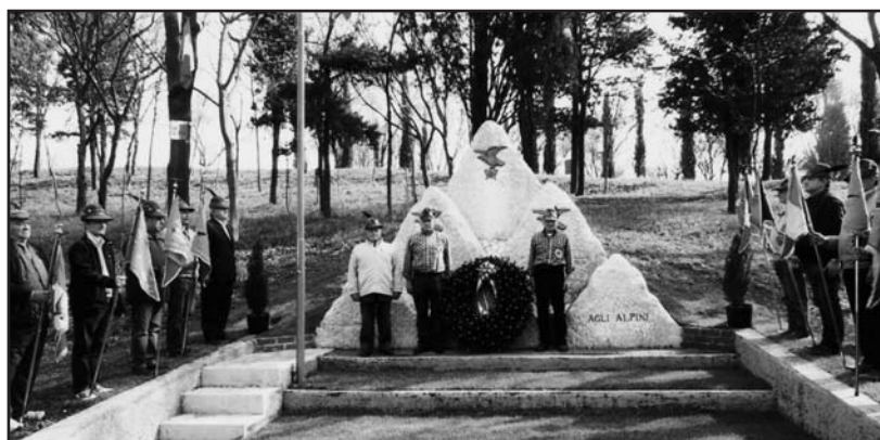
La posa della Corona d'alloro presso il monumento degli Alpini sul Colle di S. Pancrazio.

Classico il programma, con l'alza bandiera e l'inno nazionale presso la sede, per poi proseguire in corteo fino al monumento degli alpini, posto sul colle di S. Pancrazio, per la posa della corona. Successivamente, nella suggestiva Pieve di S. Pancrazio è stata celebrata la santa messa da don Alfredo che, come tutti i sacerdoti, ha avuto parole di apprezzamento per gli alpini locali che si rendono sempre disponibili per la comunità. A conclusione, è stata illustrata, da un amico studioso della Pieve, la peculiarità del luogo sacro.